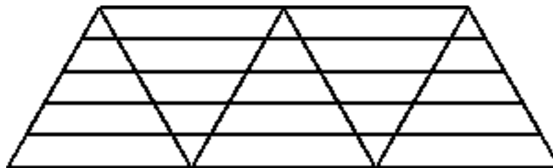
cs trokuti 5 100